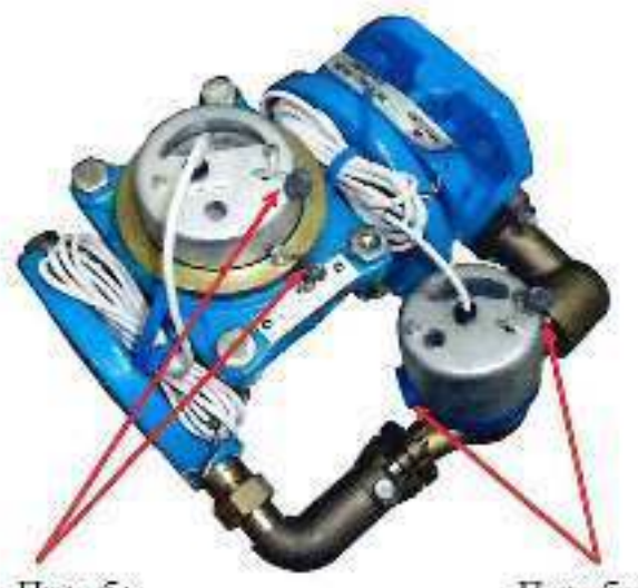
б) Счетчик холодной воды комбинированный ВСХНКд-50/20