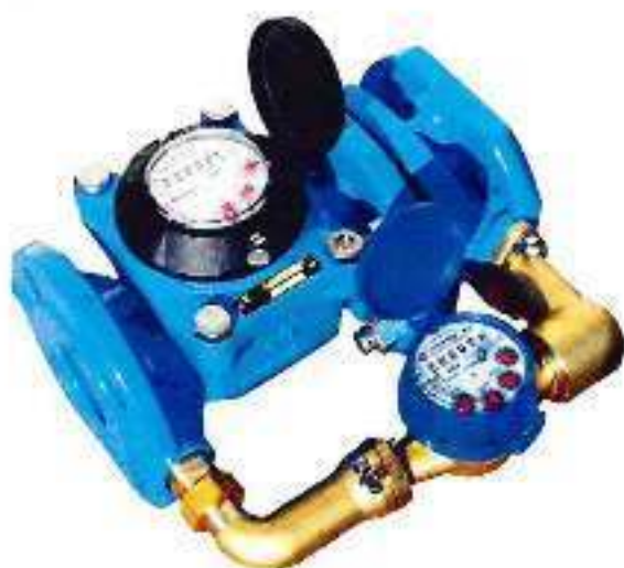
а) Счетчик холодной воды комбинированный ВСХНК-50/20

Общий вид счетчиков холодной воды комбинированных ВСХНК, ВСХНКд приведен на рисунке 1.